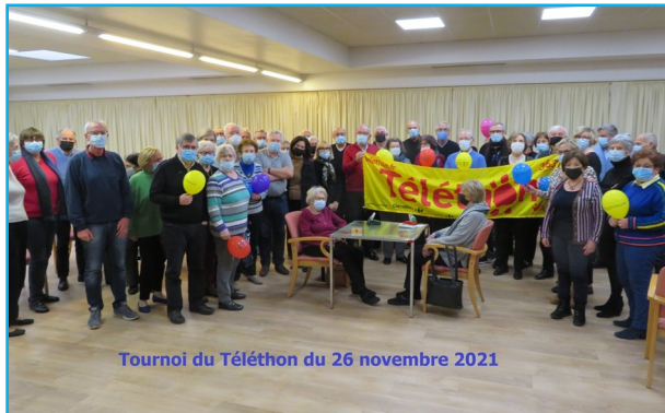
Tournoi du Téléthon du 26 novembre 2021

Le grand Patton de l'automne a été organisé le mercredi soir 24 novembre, avec des petites douceurs en entrée dès 20h00. Bravo à l'équipe Jeannin qui a remporté l'épreuve haut la main devant les 10 autres équipes